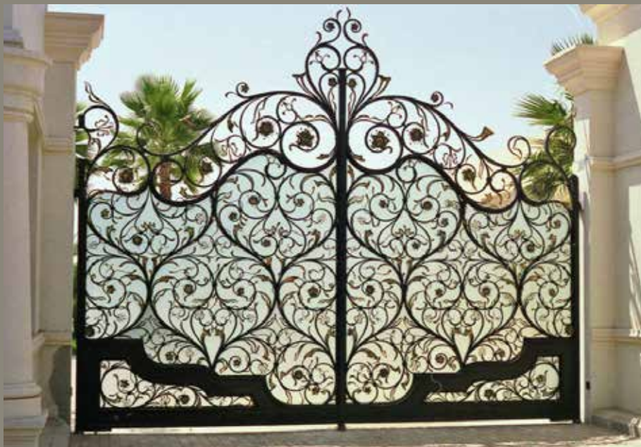
Riyād, villa privata

SAMPIETRO è la scelta naturale dell'edilizia per una serie di elementi che impreziosiscono ville, case, palazzi ed edifici pubblici, realizzati specificatamente sullo stile di ogni fabbricato e sul gusto del cliente. Cancelli, gazebo, serre, pensiline: le capacità artistiche si mescolano mirabilmente alla tecnica progettuale, con particolare attenzione anche agli aspetti normativi.