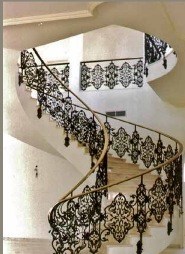
Riyād, villa privata

SAMPIETRO arricchisce, dal punto di vista stilistico ed architettonico, ogni tipo di costruzione con porte, inferriate, parapetti per scale e balconi; forme meravigliose che prendono vita e vanno a completare costruzioni esistenti. Conservando la sensibilità del committente che si rispecchia pienamente nell'opera realizzata.